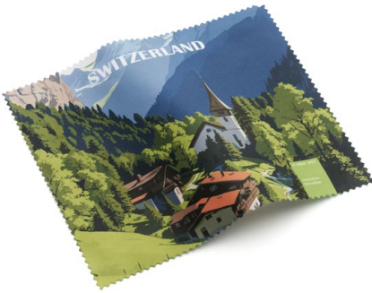
Ansicht des fertigen Brillentuchs